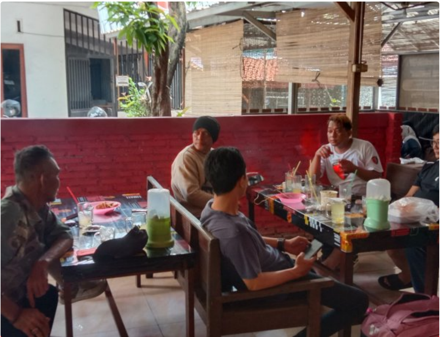
KOMUNITAS WARTAWAN LOKAL (KAWAL) Rakor Program Kerja

BANYUMAS - Komunitas Wartawan Lokal (Kawal) di Banyumas, mengadakan kegiatan Silaturahmi dan Rapat Koordinasi yang fokus pada penguatan peran pers dan penyusunan program kerja, Sabtu (31/01/2026).