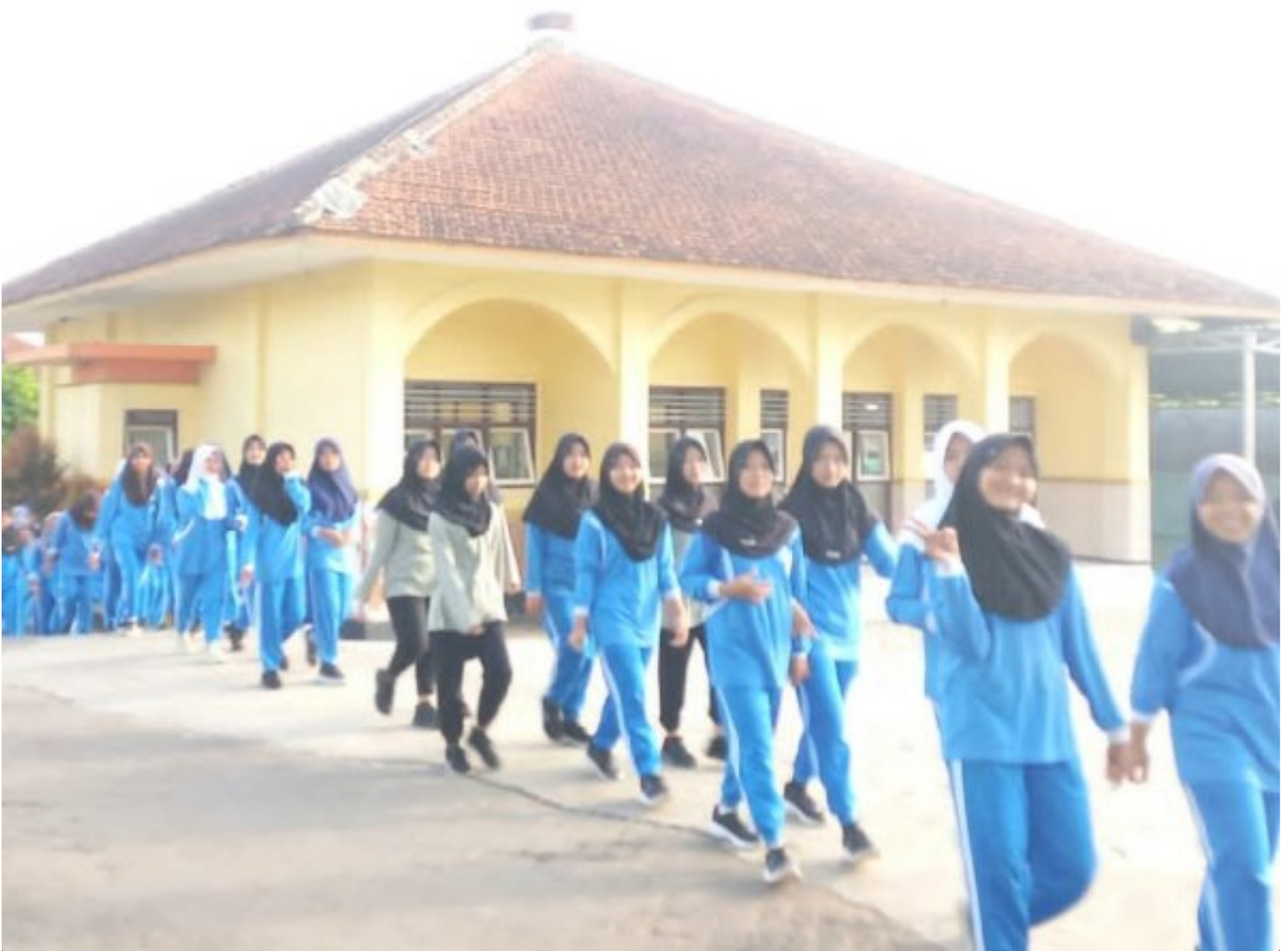
Langkah Pagi Penuh Berkah, MTsN 1 Banyumas Gemakan Jalan Sehat Bangkitkan Jiwa dan Raga

Banyumas - Suasana pagi di MTsN 1 Banyumas bergelora oleh langkah kebersamaan saat madrasah ini menggelar jalan sehat pada Jumat, 9 Januari 2026, pukul 07.00 WIB.