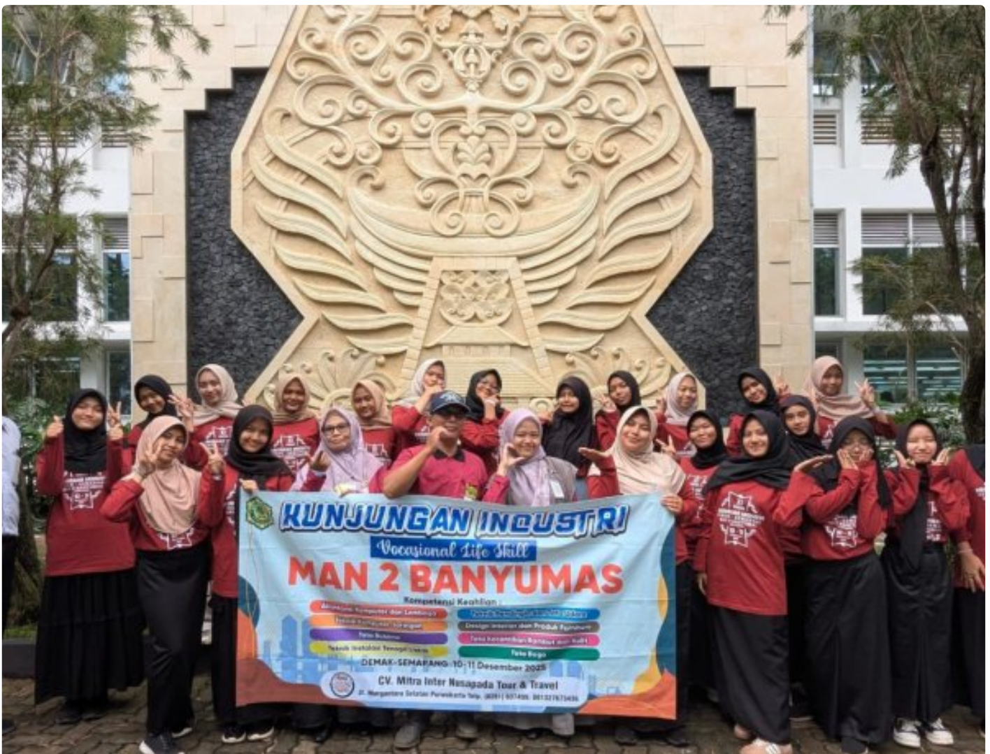
MAN 2 Banyumas Kirim 175 Siswa Vokasi ke Semarang, Kunjungan Industri dan MoU Strategis

Banyumas - Dalam ikhtiar memadukan ilmu dan amal, MAN 2 Banyumas memberangkatkan 175 siswa Kelas XI Program Vokasi untuk mengikuti Kunjungan Industri (KI) ke Semarang, 10–11 Desember 2025.