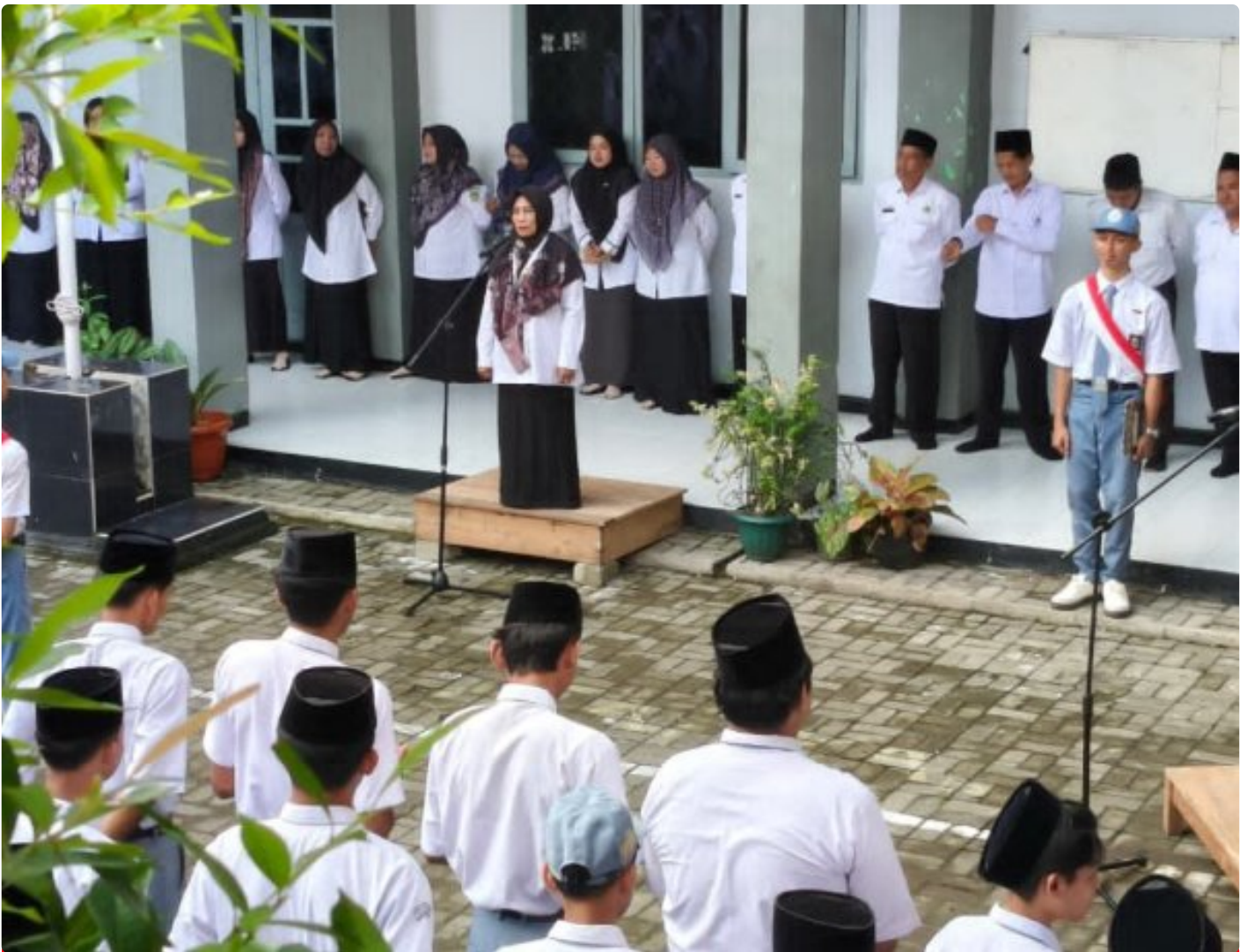
Pengawas Madrasah Teguhkan Karakter Emas Siswa MA Al Falah Jatilawang

BANYUMAS - MA Al Falah Jatilawang, Kabupaten Banyumas, Jawa Tengah, menggelar upacara bendera dengan khidmat di halaman madrasah, pada Senin (19/01/2026).